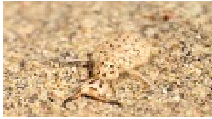
Larva originale Letardi

Le larve di questo formicaleone, abbondanti solo nei tratti di costa meno degradati, colonizzano le sabbie sciolte alla sommità delle dune litoranee (a volte spingendosi fino addirittura la battigia), di solito in corrispondenza dell'associazione vegetale Ammophiletum (Principi, 1947b; Steffan, 1975, Pantaleoni, 1990). Le località di cattura sono generalmente prossime al litorale. Le larve, spesso sepolte alla base delle piante psammofile, dove sono protette dagli agenti atmosferici, sono predatori aggressivi e attivi, in grado di portare avanti rapidamente la preda per un breve tratto; durante il giorno sono nascoste sotto la superficie della sabbia, cacciando alla posta, mentre durante la notte vagano liberamente sulle dune (Badano & Pantaleoni, 2014).