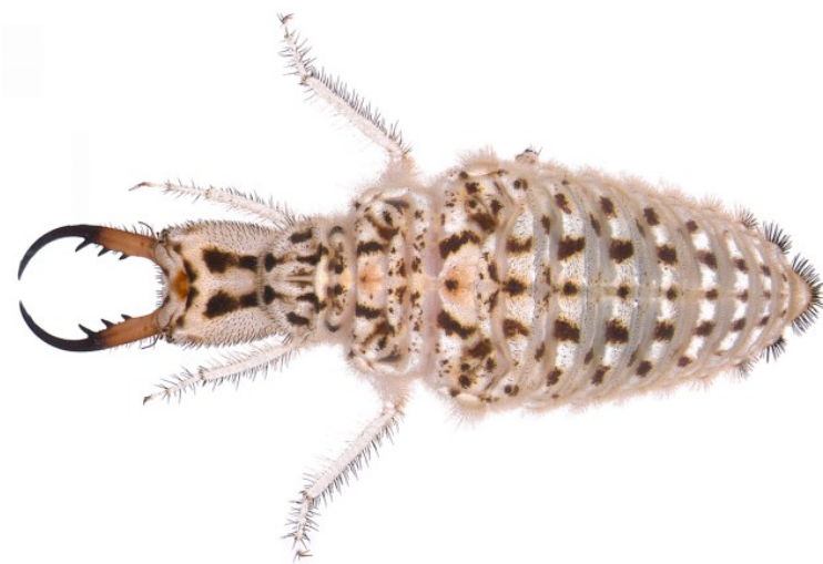
Larva da Badano & Pantaleoni, 2014

Le larve di questo formicaleone, abbondanti solo nei tratti di costa meno degradati, colonizzano le sabbie sciolte alla sommità delle dune litoranee (a volte spingendosi fino addirittura la battigia), di solito in corrispondenza dell'associazione vegetale Ammophiletum (Principi, 1947b; Steffan, 1975, Pantaleoni, 1990). Le località di cattura sono generalmente prossime al litorale. Le larve, spesso sepolte alla base delle piante psammofile, dove sono protette dagli agenti atmosferici, sono predatori aggressivi e attivi, in grado di portare avanti rapidamente la preda per un breve tratto; durante il giorno sono nascoste sotto la superficie della sabbia, cacciando alla posta, mentre durante la notte vagano liberamente sulle dune (Badano & Pantaleoni, 2014).