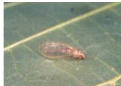
Originale Foto Nicoli Aldini

Specie dalla biologia solo superficialmente conosciuta, con larve acquatiche; adulti raccolti tra i 400 e i 1300 m s.l.m. con periodo di volo tra maggio e luglio (Aspöck et al., 1980).