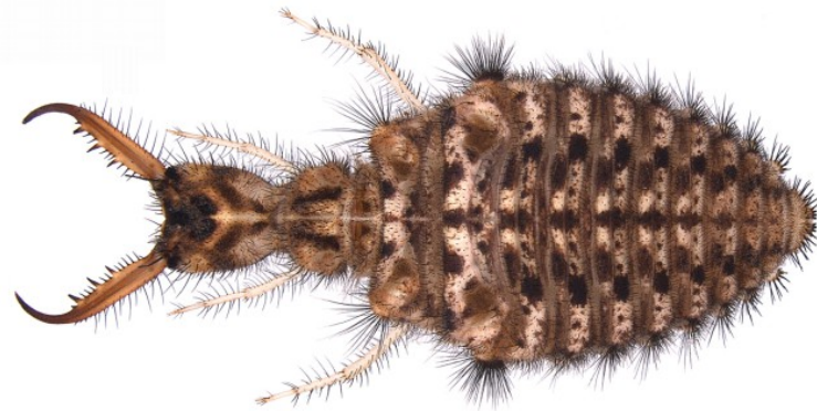
Larva da Badano & Pantaleoni, 2014

Specie con larva costruttrice di imbuti, in nord Europa su dune litoranee, in quella centro meridionale in aree sabbiose interne (Aspöck et al., 1980). Gli imbuti sono costruiti in condizioni esposte, anche se i primi stadi larvali si trovano spesso in prossimità di vegetazione (Badano & Pantaleoni, 2014). In Italia è sempre più difficile da reperire e non è da escludere che il suo areale si stia qui spostando verso Nord per il mutare delle condizioni climatiche generali (Nicoli Aldini, comm, pers.).