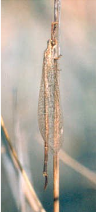
Adulto maschio Foto A. Letardi originale