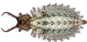
Larva da Badano & Pantaleoni, 2014b

Questo Ascalafide colonizza principalmente la più bassa fascia collinare e raramente risale sopra i 600 - 700 m di quota. Il periodo di volo