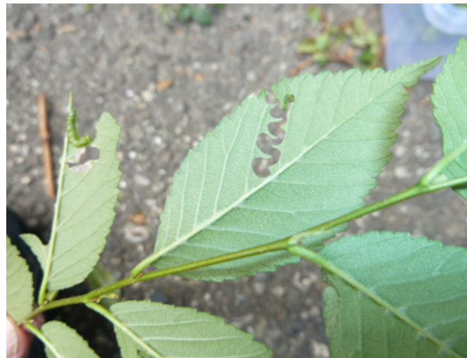
Fig. 13: 01.07.2014, Zickzack-Blattfraß;