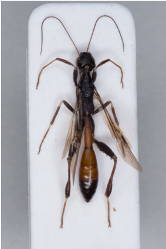
Stephanus serrator (Fabricius, 1798) = coronatus Panzer (Fig. 14) Vahrn, 830m, Fichte, VI.2014, leg./ Foto G. Mörl