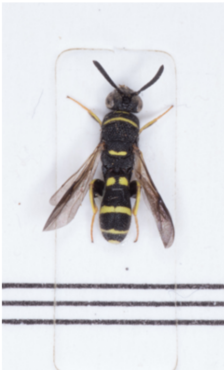
Leucospis bifasciata Klug, 1814 ♂ (Fig. 15a links: Parasitoid; 15b rechts: Wirts-Biene) leg. K. Helligl