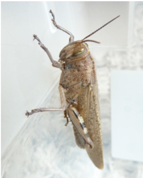
Fig.3: Imago (frischgeschlüpft): 13.10.13