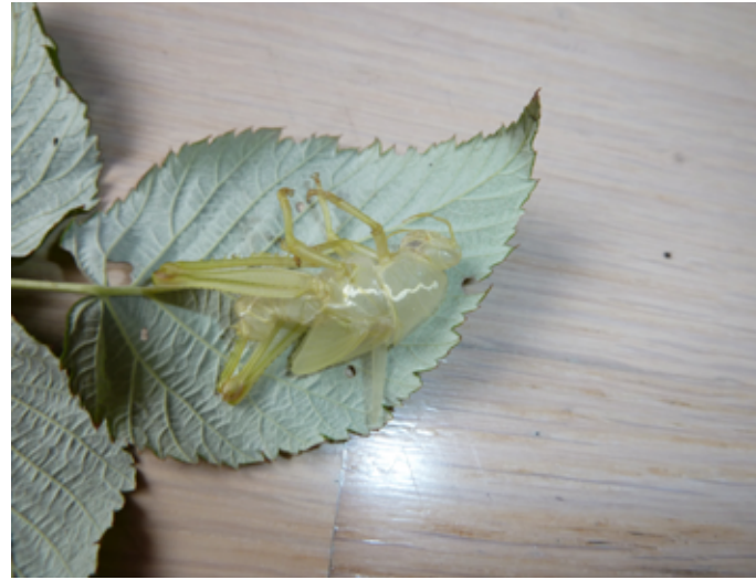
Fig.2: Larvenhaut: 13.10.2013