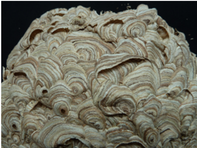
Fig. 17a: Nesthülle, Nestpapier beige: 31.07.2014