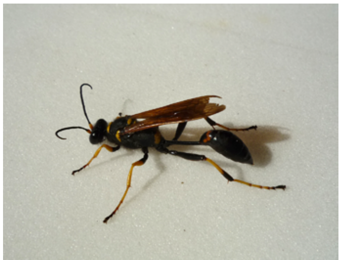
(Fig. 18): Sceliphron caementarium (Drury, 1773) "Black and Yellow Mud Dauber" Brixen, Köstlan-Gärtnerei, VI.2010, in Anzahl an Wasserpflütze, leg. Mörl; Eingeschleppte Art aus Nordamerika;