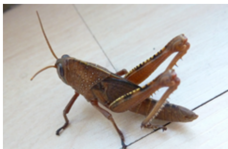
Fig.5: Larve 2: 31.10.2013