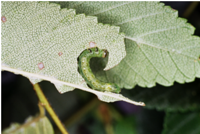
Fig. 10: 10.07.2014, Larvenfraß