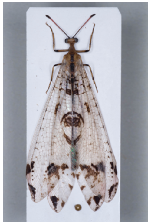
Villnöss, 20.01.2015, leg.

Dendroleon pantherinus (Fabricius 1787) Panther-Ameisenjungfer (Fig. 9)