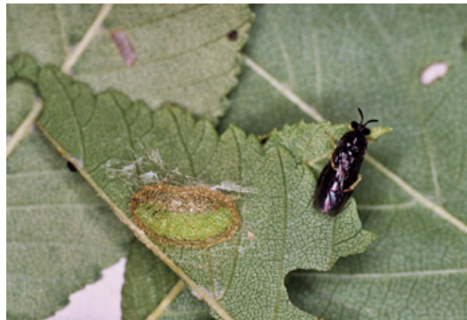
Fig. 11: 10.07.2014, Puppe und Blattwespe;