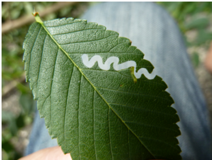
Fig. 12: 01.07.2014, Zickzack-Blattfraß;