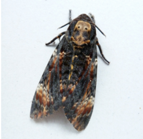
Fig.6: Totenkopfschwärmer, Brixen/Garten;

Acherontia atropos (Linnaeus 1758). Totenkopfschwärmer (Fig. 6-7): 02.11.2013