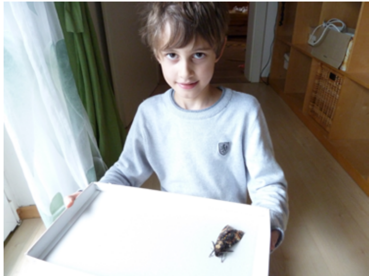
Fig.7: Alexander H. mit lebend. Schwärmer;

Ceruchus chrysomelinus (Hochenwarth 1785). Rindenschröter (Fig. 8)