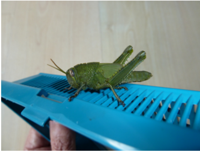
Fig.1: Larve 1: Garten, 10.10.2013