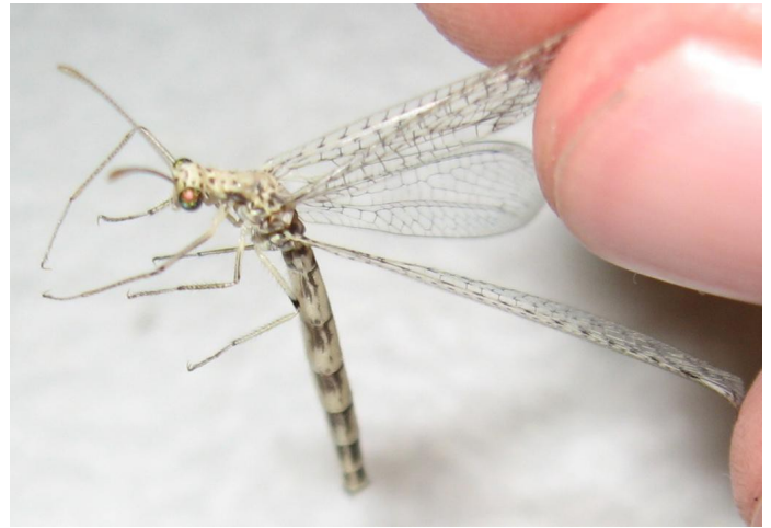
adulto(sopra), larva (sotto)