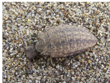
Adulto dal sito www.insecte.org