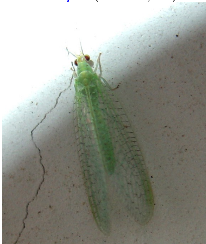
Adulto dal web