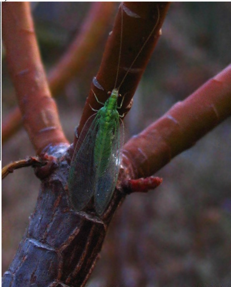
adulto da Casnati, 2007g

Senza particolari esigenze ecologiche o di habitat, frequenta gli strati arboreo ed arbustivo, per lo più delle latifoglie, pur senza disdegnare le Conifere (Principi, 1956a), con presenze diffuse seppur poco abbondanti in Europa centro-settentrionale, ove sembra mostrare una certa preferenza per le quercete tendenzialmente calde (Aspöck et al., 1980). Specie sub-dominante invece in habitat seminaturali di aree mediterranee. Non è escluso che questa genericità ecologica derivi dalle difficoltà tassonomiche. E' stata rinvenuta in Romagna sia su latifoglie che su Conifere; è una delle specie più abbondanti su Pinus (Pantaleoni, 1988). Questa specie è un predatore chiave per il controllo di popolazioni afidiche, in particolare in vigneti ed oliveti.