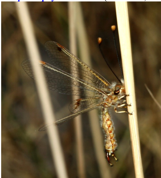
Maschio da Niolu, 2007