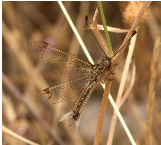
Femmina da Niolu, 2007