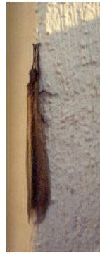
Adulto femmina