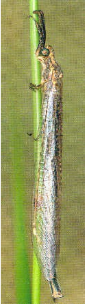
Adulto maschio