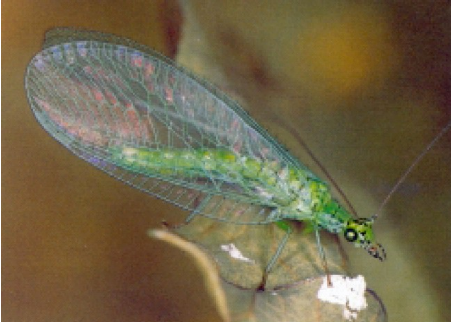
Adulto da Wachmann e Saure., 1997